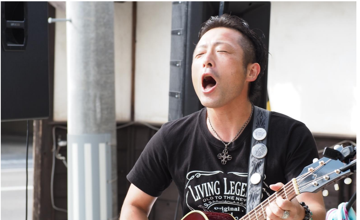
喜多方でも吠えております