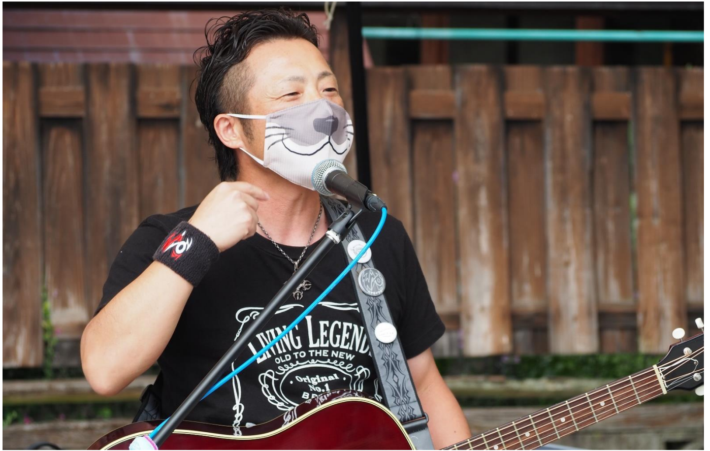
アクアマリン福島から来たカワウソです(笑)